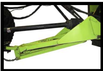
- Parallelzug -