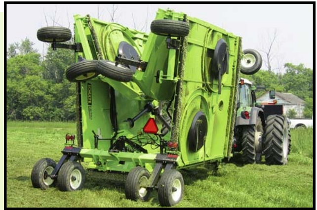
- Standardvariante mit messerteller -