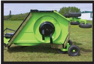
- verstärkte Messerteller & Deckschutzringe -