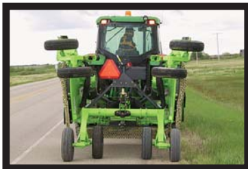
- schmale Transportbreite -