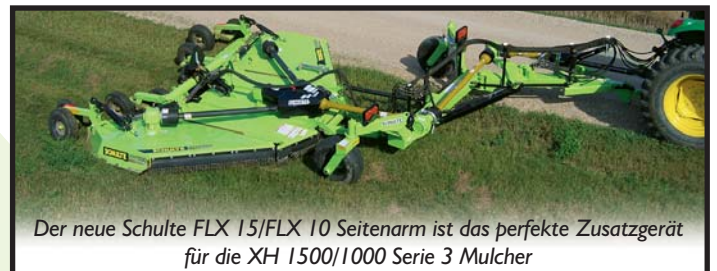
Der neue Schulte FLX 15/FLX 10 Seitenarm ist das perfekte Zusatzgerät für die XH 1500/1000 Serie 3 Mulcher